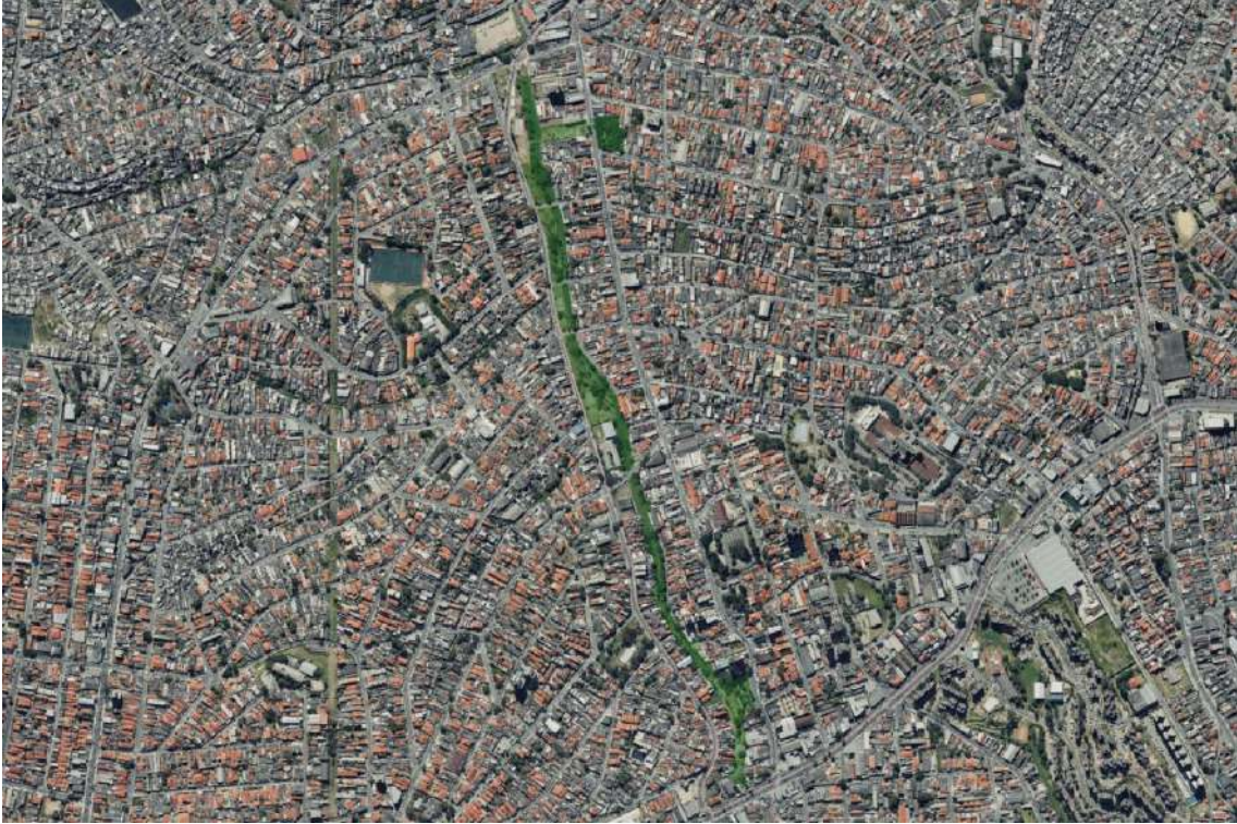
Mapa 2: Ortofoto. Localização do Parque Municipal Linear Mongaguá.

PARQUE MUNICIPAL LINEAR MONGAGUÁ - FRANCISCO MENEGOLO | SEI Nº 6027.2023/0007648-0